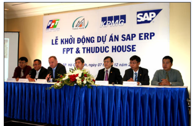
LỄ KHỞI ĐỘNG DỰ ÁN SAP ERP