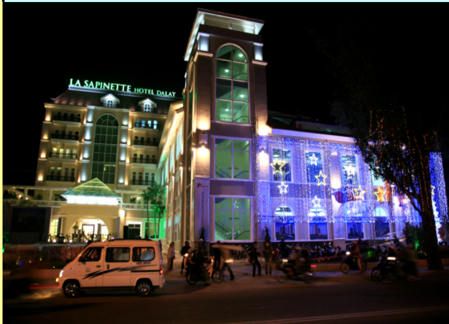
KHÁCH SẠN LA SAPINETTE ĐÀ LẠT