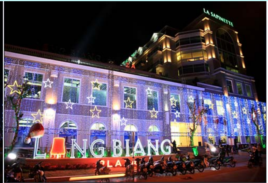
TRUNG TÂM LANG BIANG PLAZA